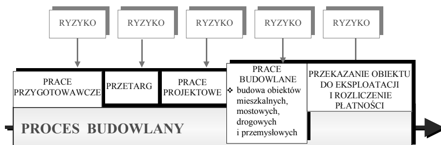
Rys. 1. Ideogram występowania ryzyka w procesie budowlanym

W procesie badawczym założono możliwość dokonania dezagregacji ryzyka budowlanego na pięć wymienionych etapów (rys. 1). Takie założenie ułatwia analizę i ustalenie hierarchii obszarów ryzyka.