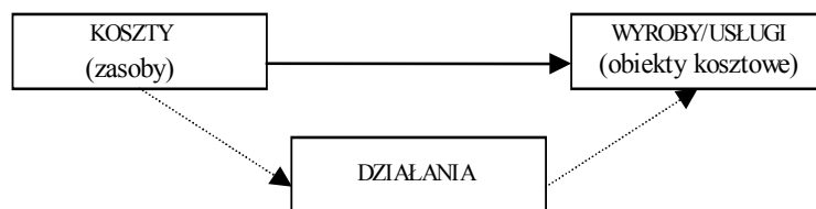
Rys. 1. Idea dwustopniowego rozliczania kosztów według metody ABC —> tradycyjna kalkulacja kosztów, .....> kalkulacja według metody ABC

Podstawą do zbudowania koncepcji ABC było spostrzeżenie, że najważniejszym elementem każdej organizacji są działania. Rachunek kosztów działań opiera się na pomiarze kosztów według struktury wyodrębnionych aktywności. Idea metody ABC wyraża się w stwierdzeniu, że produkty/usługi nie są bezpośrednią przyczyną powstawania kosztów, mimo że w celu ich wytworzenia zużywane są zasoby. Pieniądze wydaje się w związku z wykonywaniem określonych działań, które z kolei są wykorzystywane na rzecz produktów bądź usług (tzw. obiektów kosztowych) [2, s. 303–304; 4, s.10; 9, s. 515–517]. Rysunek 1 prezentuje ideę metody ABC w kontekście tradycyjnych sposobów kalkulacji kosztów.